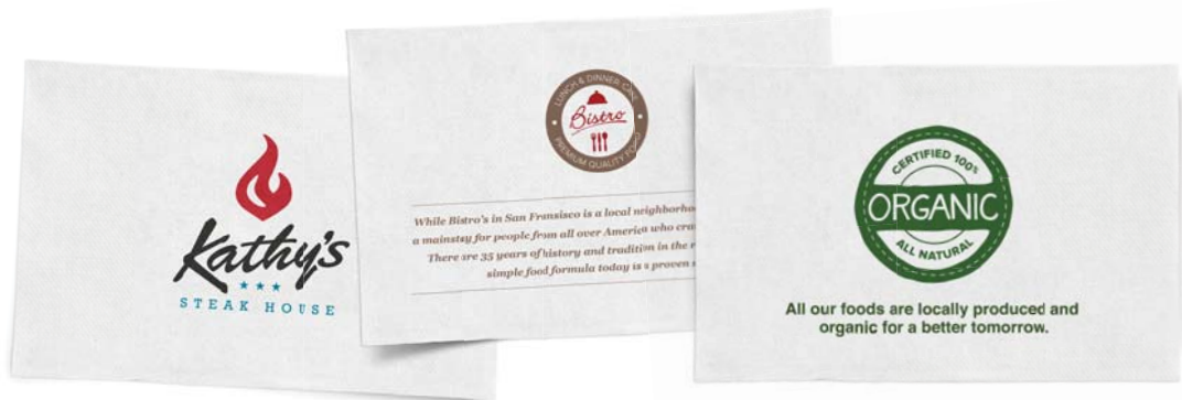
Prezentuj swoje logo

Wydrukuj swoje logo lub wiadomość w maksymalnie 3 kolorach, wybieraj spośród wszystkich rodzajów jakości oraz rozmiarów serwetek dyspenserowych. Jeśli chcesz dowiedzieć się więcej o serwetkach dyspenserowych z nadrukiem skontaktuj się ze swoim przedstawicielem handlowym.